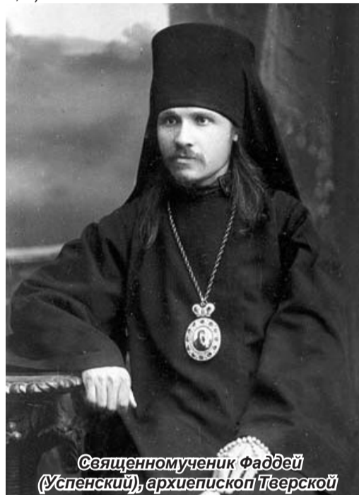
Священномученик Фаддей (Успенский), архиепископ Тверской

Оба одинаково «предали души свои» (Деян. 15, 26) за слово Божие и за свидетельство об имени Господа Иисуса Христа, желая упасти овец стада Христова и уневестить Христу Церковь из язычников, искупленную Кровию Его. Один, будучи камнем веры, первый «утвердил братию» (Лк. 22, 32), рассеявшуюся от страха гонений за имя Христово по воскресении, и впервые разъяснил, что к Церкви, состоявшей доселе из одних сынов Израилевых, Бог повелевает присоединять обращающихся из язычников (Деян. 15, 7-11). Другой, будучи «избранным сосудом, чтобы возвещать имя Христово» (Деян. 9, 15) народам, которые еще не слышали о Христе (Рим. 15, 20-21), прошел со словом проповеди едва не всю известную тогда вселенную, чтобы «возвеселилась неплодная, нерождающая» Церковь (Гал. 4, 27; Ис. 54, 1) и «возрадовалась земля сухая и необитаемая» сердца язычников (Ис. 35, 1). Оба, в равной мере исполненные любви ко Христу, всю жизнь посвятили проповеданию Слова и трудам апостольства и оба запечатали мученической кончиною свою любовь ко Христу. Один, вначале отрекшись от Христа, потом всю жизнь в покаянии следовал за Ним как бы на распятие, претерпев искушения огненные и наветы сатаны (1 Пет. 4, 12;