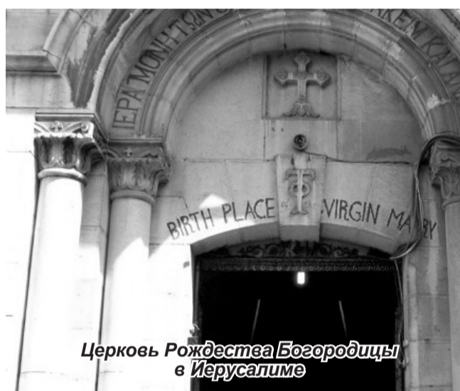
Церковь Рождества Богородицы в Иерусалиме

21 сентября православные верующие отмечают один из двенадцати важнейших христианских праздников — Рождество Пресвятой Богородицы