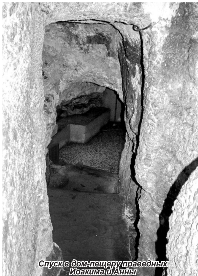
Спуск в дом-пещеру праведных Иоакима и Анны

Будем же все светло торжествовать праздник Рождества Пресвятой Девы Марии, украшаясь сами всякими добродетелями христианскими. Аминь.